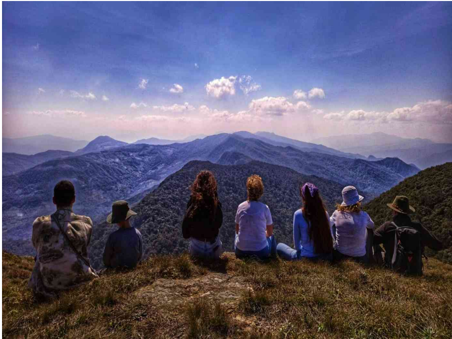
Ausblick vom Nebelwald Nähe Samaipata