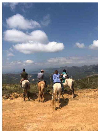
Reitmöglichkeiten in die Umgebung von Samaipata

Rückreise nach La Paz- Rückflug nach Santa Cruz am späteren Nachmittag und Taxis Transfer nach Samaipata - die letzten Tage verbringt Ihr wieder im Casa YVY bis zu Eurem persönlichen Rückflugtermin. Die verbleibenden Übernachtungstage in Samaipata sind nicht mehr im Reisepreis enthalten.