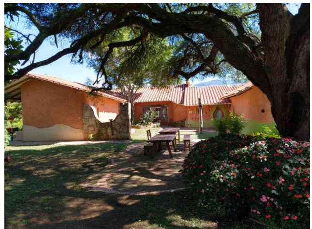
Casa YVY Hotel