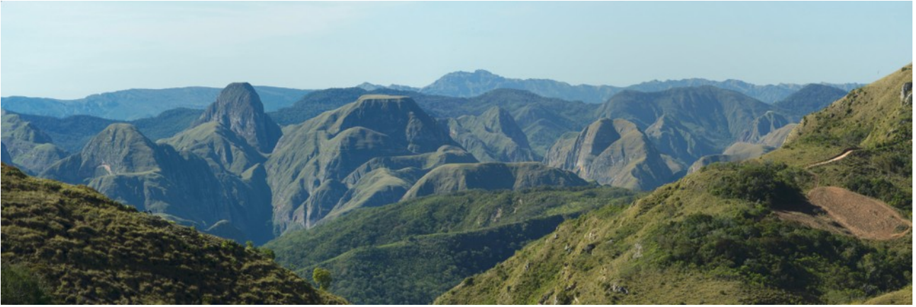
Bolivien Amboro Nationalpark